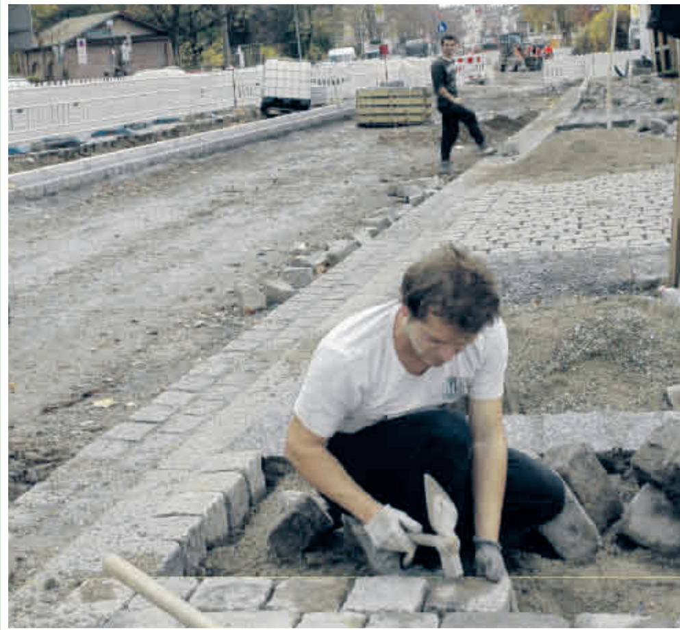
Im südlichen Abschnitt zeichnet sich die „neue Habsburgerstraße“ bereits ab. Erkennbar ist die Fahrspur, die bald asphaltiert wird sowie der gepflasterte Parkstreifen (großes Bild). Die kleinen Bilder zeigen den fast fertiggestellten Gehweg im Bereich der Rotlaubstraße (oben) sowie die Straßenarbeiten nahe der Tennenbacher Straße.

In der Habsburgerstraße geht es weiter rund – schließlich sind die Arbeiten schon weit über die Hälfte vorangeschritten und dazu recht genau im Zeitplan. Jetzt, kurz vor dem Winteranfang, beginnen am 30. November auch die Arbeiten an den Gleisen, die Asphaltarbeiten von Gehwegen und Fahrbahnen laufen bereits auf Hochtouren. Deshalb muss auch bis Ende Februar 2010 der Abschnitt zwischen Hermann-Herder-Straße und Rheinstraße stadteinwärts gesperrt werden. Stadtauswärts hingegen wird es zu keiner Zeit zu Sperrungen oder Umleitungen kommen. Was die Baustellenmanager jetzt besonders hervorheben: Um mit möglichst wenig „Verspätung“ über den Winter zu kommen, hofft man auf mildes Wetter, da ein gefrorener Boden über längere Zeit die Straßenarbeiten massiv behindern würde. Wie das ausgeht, wird man Anfang nächsten Jahres sehen. Wer aber aktuell auf dem Laufenden bleiben will, bekommt dienstags von 15 bis 19 Uhr im Baubüro in der Habsburgerstraße 98 Antworten auf alle Fragen.