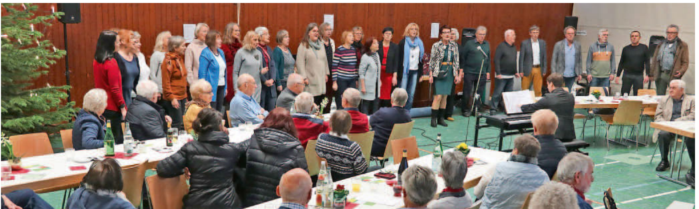
Chorisso überbrachte schwungvolle Neujahrsgrüße.