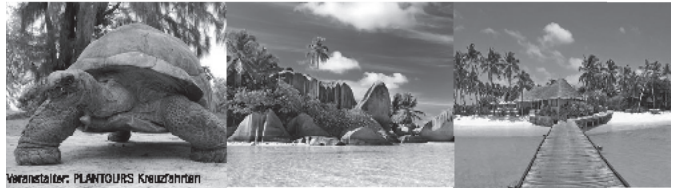
Veranstalter: PLANTOURS Kreuzfahrten

Bordguthaben € 50,- pro Person Kombi-Ersparnis mit der Anschlusskreuzfahrt Madagaskar & Mauritius sparen Sie € 1.300,-