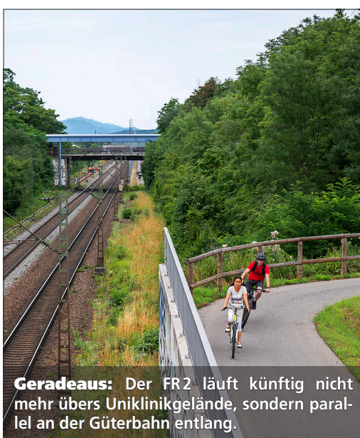
Geradeaus: Der FR2 läuft künftig nicht mehr übers Uniklinikgelände, sondern parallel an der Güterbahn entlang.

5 Friedhofstraße: Bau durchgängiger Radwege und Radstreifen im Standard einer Rad-Vor-