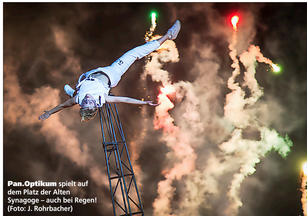
Pan.Optikum spielt auf dem Platz der Alten Synagoge – auch bei Regen!

Großes Finale mit Festakt im Theater – auch als Livestream