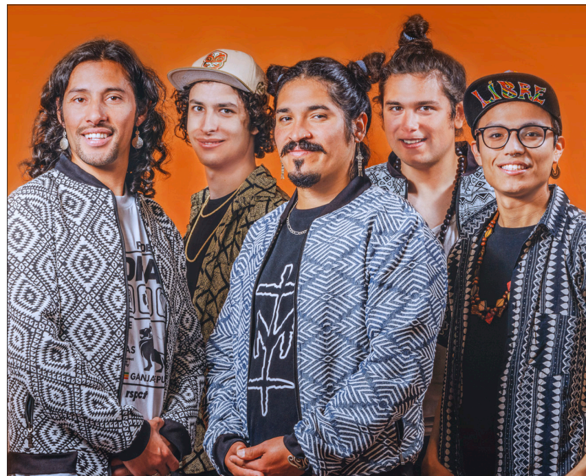
Wilde Mischung: El Flecha Negra vereint lateinamerikanische Klänge mit Reggae und Cumbia – die fünf Musiker treten am 14. August auf.

Die Regie im Eschholzpark hat Freiburg Live übernommen. Eines der Highlights dort ist der Abend am Mittwoch, 11. August, der „Kulturgesichter 0761“ gewidmet ist. Aber auch das Sea You füllt einen Abend (Freitag, 13. August). Das Programm auf dem Stühlinger Kirchplatz sowie an vier Tagen auf dem