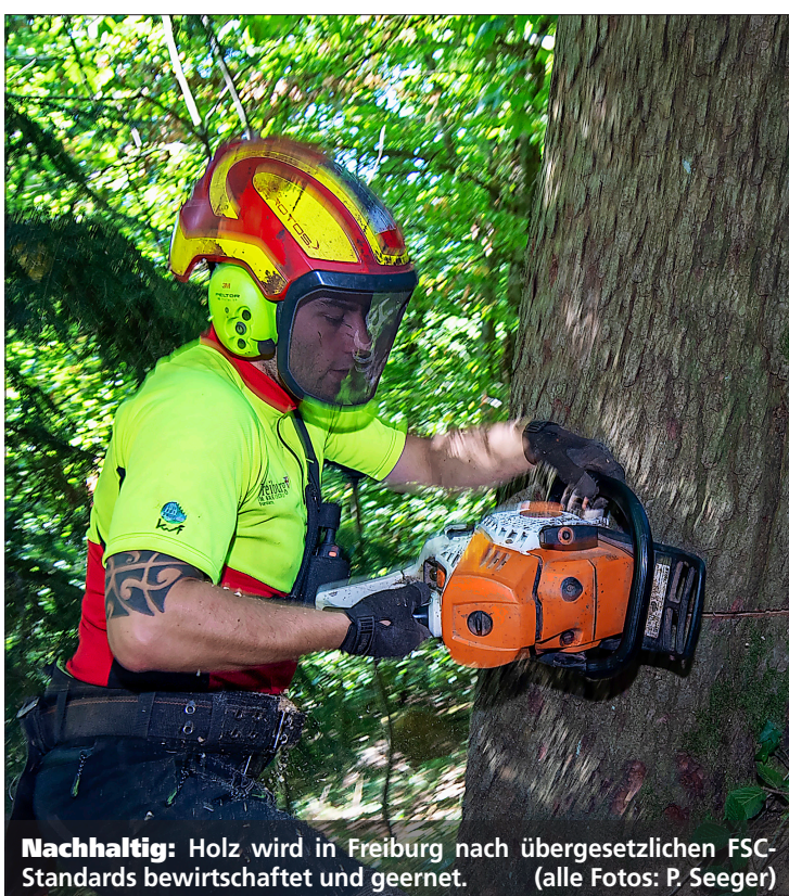
Nachhaltig: Holz wird in Freiburg nach übergesetzlichen FSC-Standards bewirtschaftet und geerntet.

höchsten Gemarkung, also von Walthershofen bis hoch auf den Schauinsland, rund 1000 Meter Höhenunterschied. Das heißt unsere Wälder wachsen zwischen 300 und knapp 1300 Metern Höhe über dem Meeresspiegel. Besonders ist auch die große Nähe von Stadt und Wald, das zieht viele Erholungssuchende an. Und wir haben insgesamt mit einem Anteil von 40 Prozent sehr viel Wald auf der städtischen Gemarkung.