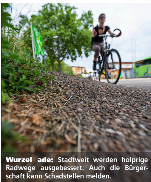
Wurzel ade: Stadtweit werden holprige Radwege ausgebessert. Auch die Bürgerschaft kann Schadstellen melden.

gehen: Die Gehwege werden breiter und barrierefrei – ebenso wie die Bushaltestelle Draistraße.