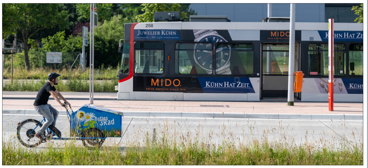
Umweltfreundliche Mobilität kann einen großen Beitrag zum Klimaschutz leisten. Allein 16 Millionen Euro gibt die Stadt dieses und nächstes Jahr für Verbesserungen im Fuß- und Radverkehr aus. Wofür genau steht auf Seite 5.

Der Verkehr spielt beim Klimaschutz eine wichtige Rolle. Bislang zeigen die Bemühungen um eine Kohlendioxid-Reduktion aber nur geringen Erfolg. Wie das geändert werden kann, will die Stadt mit dem Klimamobilitätsplan aufzeigen. Dabei ist Freiburg eine von fünf Modellkommunen im Land. Der Plan soll zeigen, wie man die CO 2 -Emissionen möglichst schnell reduzieren kann. Zunächst geht es um die Zeit bis 2030. Bis dahin sollen im Verkehrssektor 40 Prozent aller CO 2 -Emissionen im Vergleich zu 2010 eingespart werden. Das wäre ein großer Fortschritt: Von 1992 bis 2018 betrug der Rückgang in Freiburg pro Kopf nur 13,5 Prozent; insgesamt war in diesem Zeitraum aufgrund des Bevölkerungswachstums sogar ein Anstieg von 1,1 Prozent zu verzeichnen. Der Klimamobilitätsplan ist ein neues Instrument im Klimaschutzgesetz des Landes Baden-Württemberg, das der Landtag im Oktober 2020 beschlossen hat. Als eine von fünf Pilotkommunen erhält Freiburg eine finanzielle Förderung von 225.000 Euro – insgesamt kostet das Projekt 280.000 Euro.