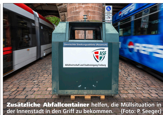
Zusätzliche Abfallcontainer helfen, die Müllsituation in der Innenstadt in den Griff zu bekommen.

Die vorläufige Bilanz fällt positiv aus: Es fiel weniger gefährlicher Müll an, und das Risiko, durch Flaschenwürfe und Scherben verletzt zu werden, wurde deutlich reduziert. Die Platznutzenden und -nutzerinnen haben das Verbot weitest-