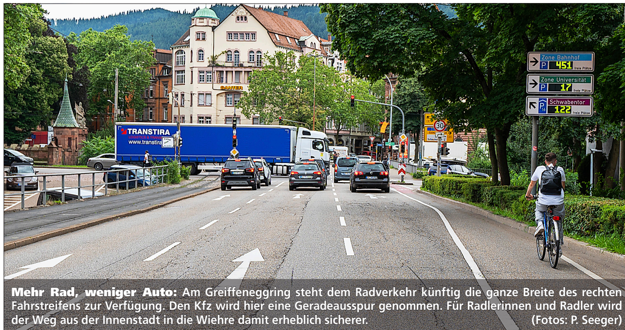
Mehr Rad, weniger Auto: Am Greiffeneggring steht dem Radverkehr künftig die ganze Breite des rechten Fahrstreifens zur Verfügung. Den Kfz wird hier eine Geradeausspur genommen. Für Radlerinnen und Radler wird der Weg aus der Innenstadt in die Wiehre damit erheblich sicherer. (Fotos: P. Seeger)

Die jetzt konkret anstehenden Projekte verteilen sich fast über das gesamte Stadtgebiet. Darunter sind Großprojekte wie die Sanierung und Umgestaltung in der Friedhofstraße, Ingenieurbauwerke wie die Rampe von der St. Georgener Straße hoch zum Güterbahnradweg FR2 oder der Lückenschluss im FR2 beim Unikli-