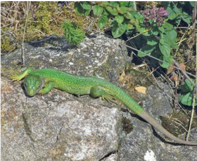
Die fotografierte Smaragdeidechse hat Frau Gertrud Lang an der St.-Erentrudis-Kapelle entdeckt.

Donnerstag, den 24. September 2015 Jahrgang 2015 Nummer 39