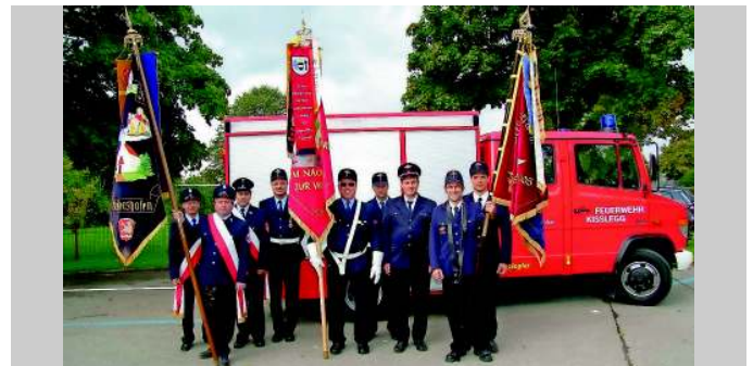
Die drei Waltershofener Feuerwehren (von links: Meitingen-Waltershofen, Kißlegg-Waltershofen, Freiburg-Waltershofen)

Das Jubiläumsfest im Allgäu bot zahlreiche Anlässe zu freundschaftlichen, insbesondere aber auch persönlichen Begegnungen, angefangen vom Festakt, einem Umzug mit Festgottesdienst, einem Dorfspiel mit den dortigen örtlichen Vereinen, einem geselligen Abend mit Allgäuer Blas- und Volksmusik bis zu einem Feuerwehrfrühstücken.