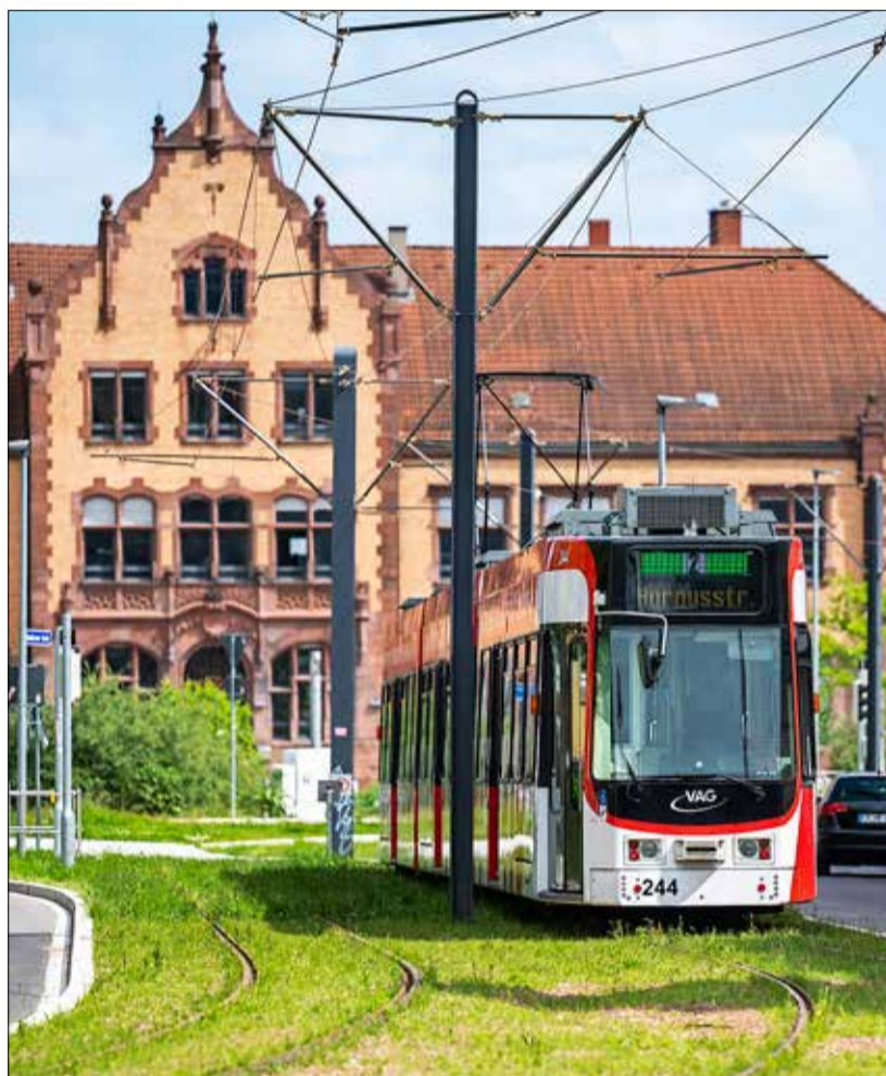
Ungewohnter Anblick: Stadtbahn vor dem Zollhallengebäude.