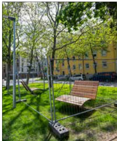
Schönes Plätzchen: Noch sind die Liegen hinter Gittern. In ein paar Wochen darf hier gechillt werden.

Nicht zu vergessen ist auch der ökologische Aspekt: Auf einem Teil der Grünfläche hat das GuT eine wertvolle Blumenwiese angelegt. Der vorhandene Baumbestand wurde