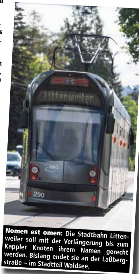
Nomen est omen: Die Stadtbahn Littenweiler soll mit der Verlängerung bis zum Kappler Knoten ihrem Namen gerecht werden. Bislang endet sie an der Laßbergstraße – im Stadtteil Waldsee.

Stadtteil Waldsee. Mit der schon seit gefühlten Ewigkeiten geplanten Verlängerung über den Bahnhof Littenweiler bis zum Kappler Knoten werden gleich mehrere Fliegen mit einer Klappe geschlagen: Künftig gibt es einen Direktanschluss an die Höllentalbahn, große Teile Littenweilers kommen erstmals in den Genuss einer fußläufigen Stadtbahnverbindung, und am Kappler Knoten