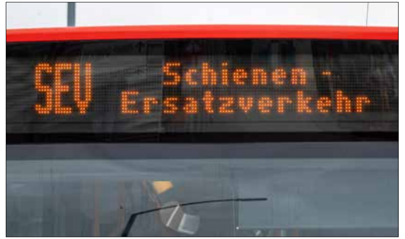
Bus statt Bahn: Während der Bauzeit gibt es einen Schienenersatzverkehr.

Fast drei Monate lang, von Donnerstag, 15. Juni, bis Sonntag, 10. September, dauert die Erneuerung der Gleise und Weichen rund um die Haltestelle „VAG Zentrum“