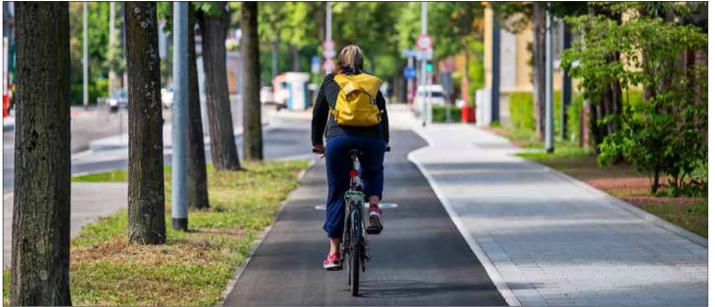
Mehr Platz für alle: Fuß- und Radweg laufen jetzt parallel entlang der Friedhofsmauer und sind breiter als zuvor. Für Menschen mit Sehbehinderungen sind die Wege durch verschiedene Beläge und ein taktiles Element voneinander getrennt.

Wichtiger Lückenschluss: Der Ausbau der Radvorrangroute FR3 geht voran