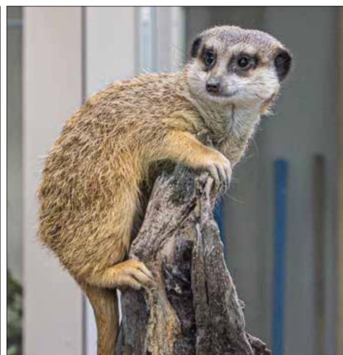
Immer auf Zack: Die Erdmännchen haben ihr neues Gehege im Sturm erobert. Gestaltet wurde es im „Kalahari-Look“: mit rötlichen Steinen und Termitenhügeln.

kann als Ganzes genutzt oder dank flexibler Torsysteme in Abteile getrennt werden. Die Tore sind von einem sicheren Raum aus zu bedienen; das schützt die Tierpflegerinnen und -pfleger etwa während der Brunft, wenn die Tiere gefährlich werden können. Alle Durchlässe sind drei Meter hoch, damit die Vögel gefahrlos hindurchschreiten können.