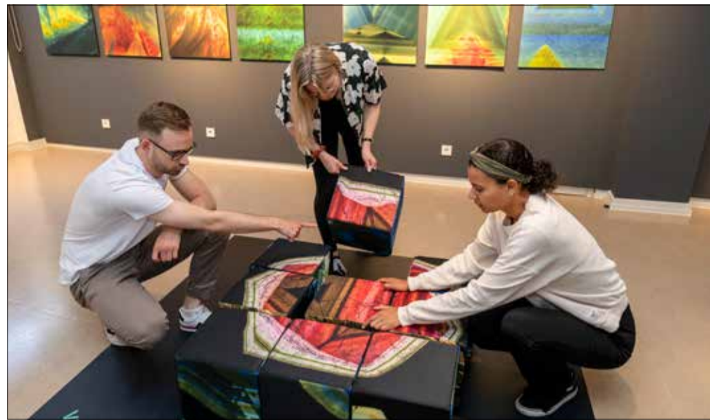
Kristalle zum Puzzeln: Wie faszinierend Turmaline in ihrem Inneren sind, können sich kleine Ausstellungsbesucherinnen und -besucher mithilfe eines Würfelspiels vorstellen.

Solche eindrucksvollen Kunstwerke der Natur entstehen, weil Turmaline während ihres Wachstums sehr sensibel auf äußere Einflüsse reagieren. Sie können durch Naturereignisse wie