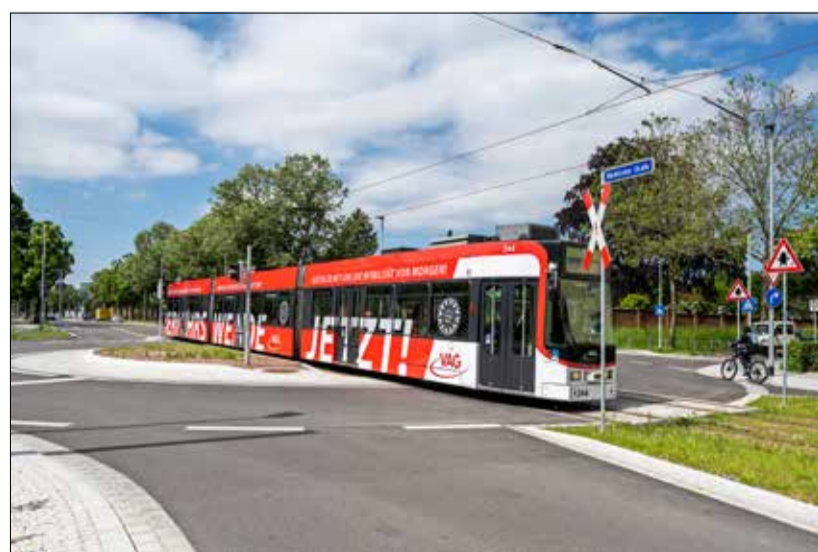
Alles anders: Die Waldkircher Straße ist kaum wiederzuerkennen. An den zwei neuen Kreisverkehren geht es für Autos und Fahrräder rund – und für die Stadtbahn kerzengeradeaus.