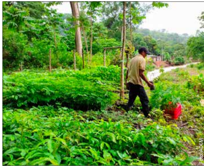
Schutz vor Starkregen: Das Aufforstungsprojekt soll Wiwilí widerstandsfähiger gegen den Klimawandel machen.

Das mehrjährige Projekt sollte eigentlich vom Bundes-