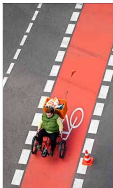
Spürbarer Fortschritt: Die neuen Radwege sind eine reine Wohltat.

Der neue Streckenabschnitt der Stadtbahnlinie 2 ersetzt mit eigenem, begrüntem Gleiskörper und zwei barrierefreien Haltestellen die maroden, fast 70 Jahre alten Gleise in der Komturstraße und erschließt zudem das sich rasch entwickelnde ehemalige Güterbahngelände, auf